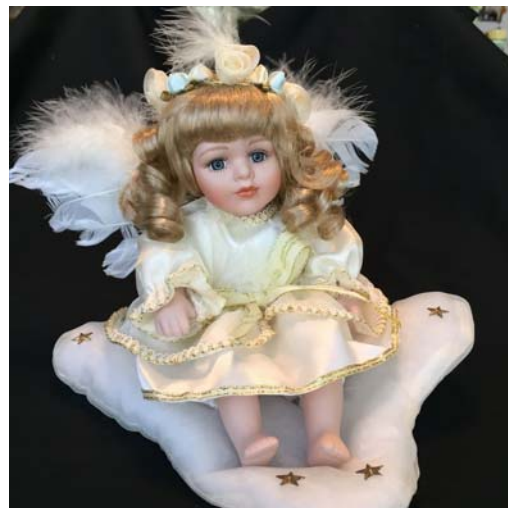
Collectable Angel Doll