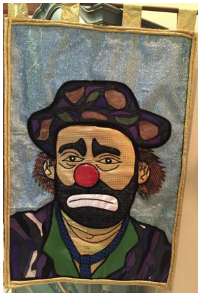
Emmett Kelly Tapestry

Llame al 377-5965 para ¡reservaciones de última hora!